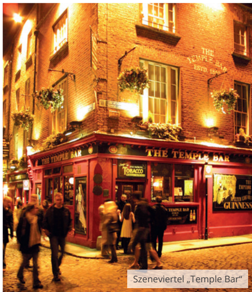
Szeneviertel „Temple Bar“