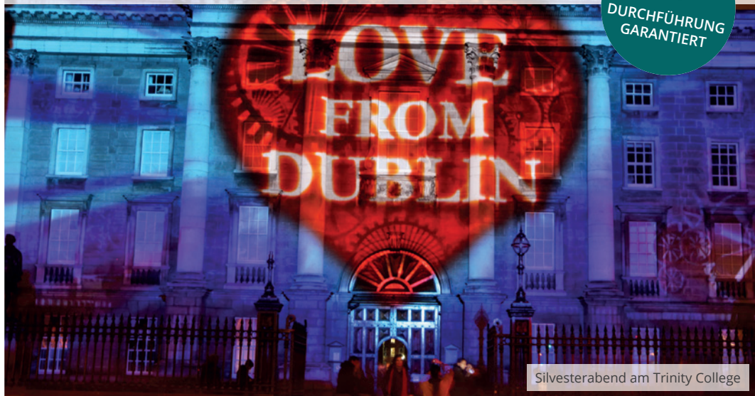
Silvesterabend am Trinity College