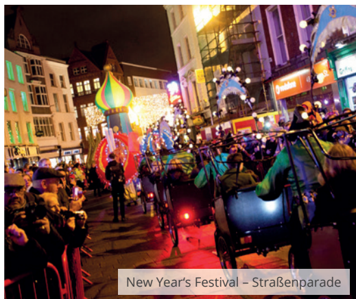
New Year's Festival – Straßenparade