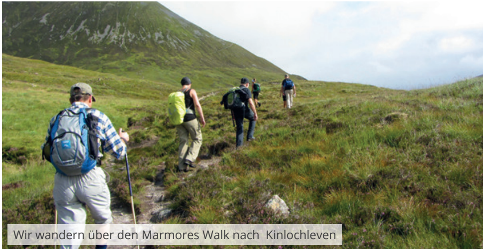
Wir wandern über den Marmores Walk nach Kinlochleven