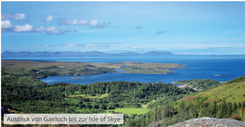
Ausblick von Gairloch bis zur Isle of Skye